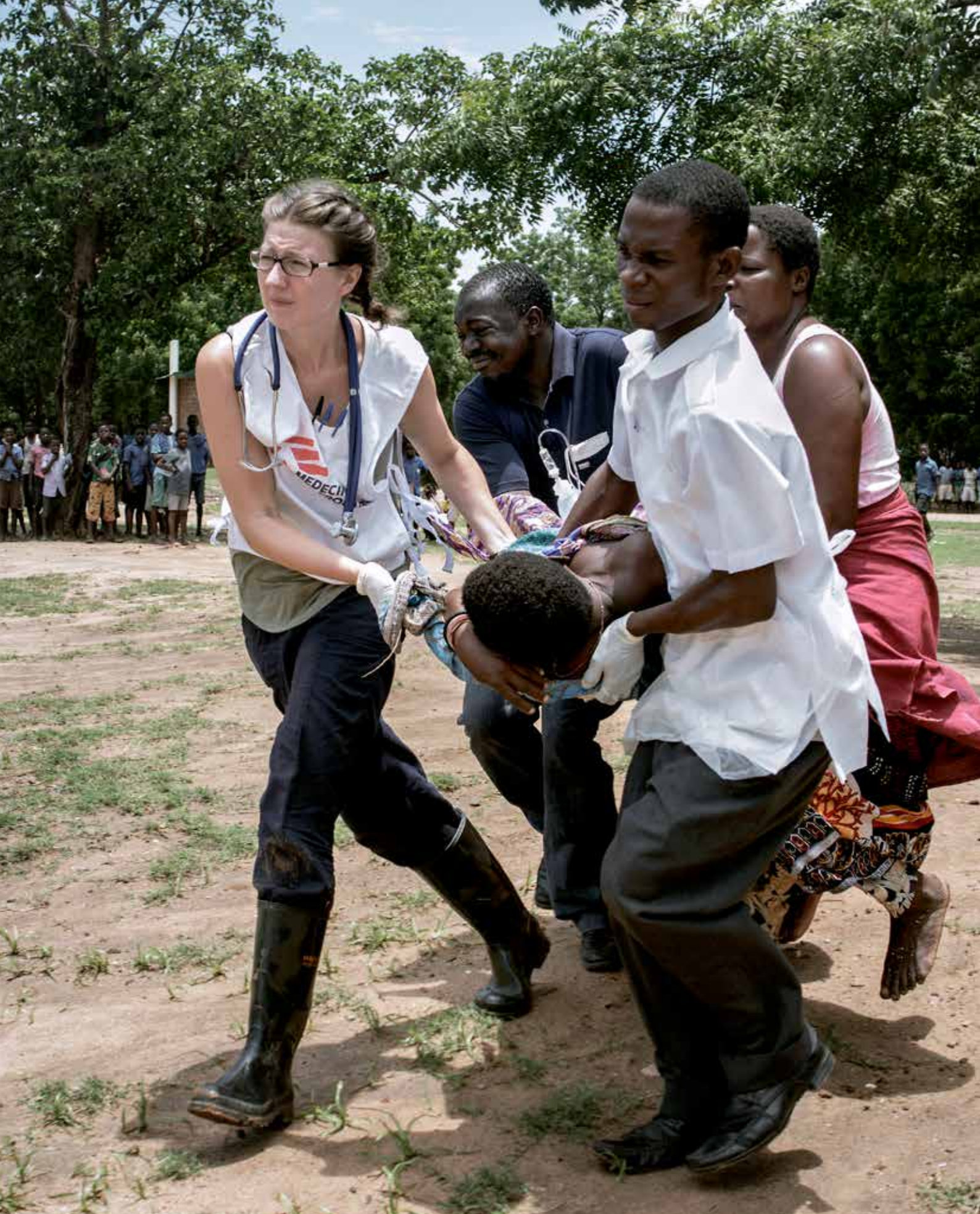
Gravide Yanesi fra Malawi fikk svangerskapskomplikasjoner i niende måned, og måtte evakueres av Leger Uten Grenser med helikopter for å ta keisersnitt på et sykehus. Til all lykke overlevde både mor og barn.